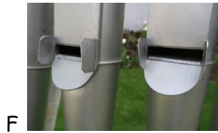
Bild gehört zur Wasserschale.

Bild ist in der Nähe des großen Tisches.